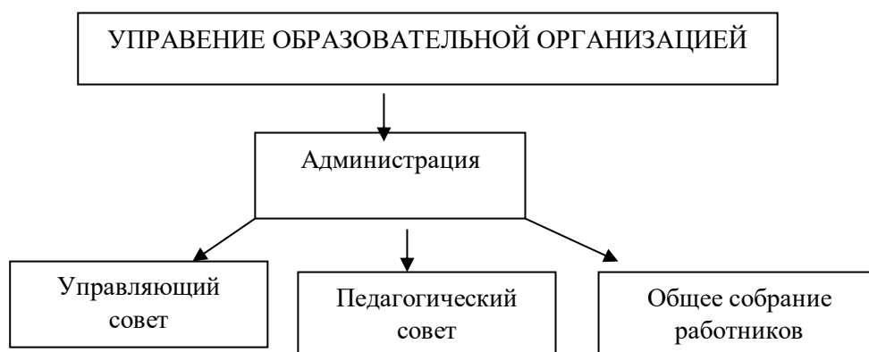
Рис. 1 Структура управления МБОУ «ООШ №21»

Механизм управления школой включает процесс взаимодействия МБОУ «ООШ № 21» и всех участников педагогического процесса. Коллегиальное управление осуществляется Педагогическим советом. Вопросы организационного характера решаются общим собранием трудового коллектива. Управление школой основывается на сотрудничестве педагогического, ученического и родительского коллективов.